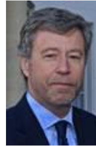
FRENCH NATIONAL CENTER FOR SCIENTIFIC RESEARCH (CNRS) Antoine MYNARD Director of China bureau