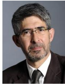
Gilles BLOCH Président de l'Université Paris-Saclay