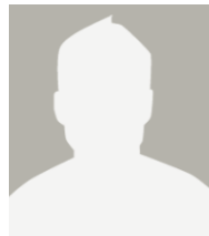
DONGFENG ZHOU Jianguang